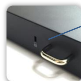
Kensington Schlösser & U- Stangenschlösser